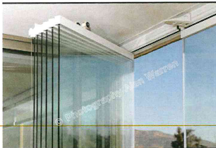
DETALLE DE CIERRES PLEGABLES