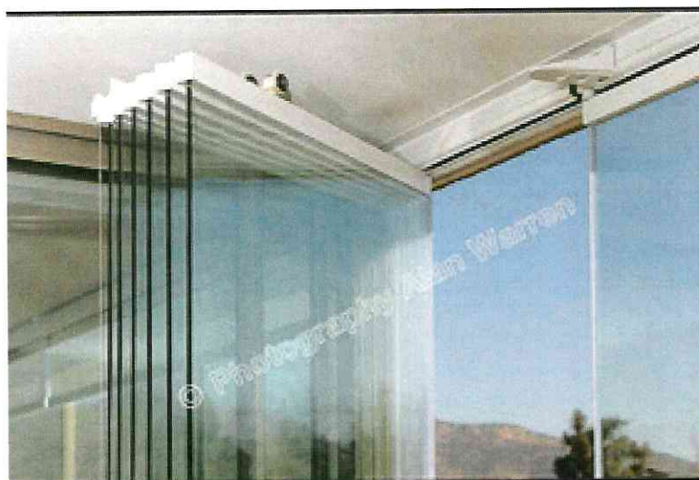
DETALLE DE CIERRES PLEGABLES