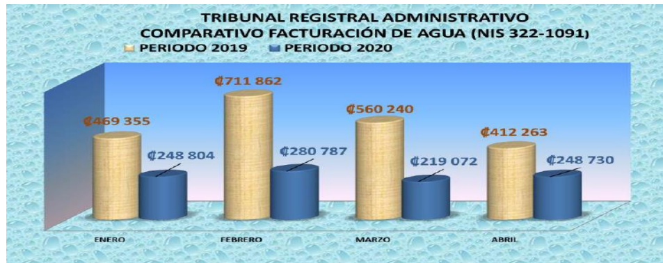
GRÁFICO NO. 1