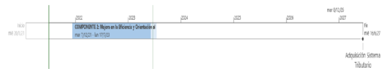
Ilustración 17 Roadmap Componente 2